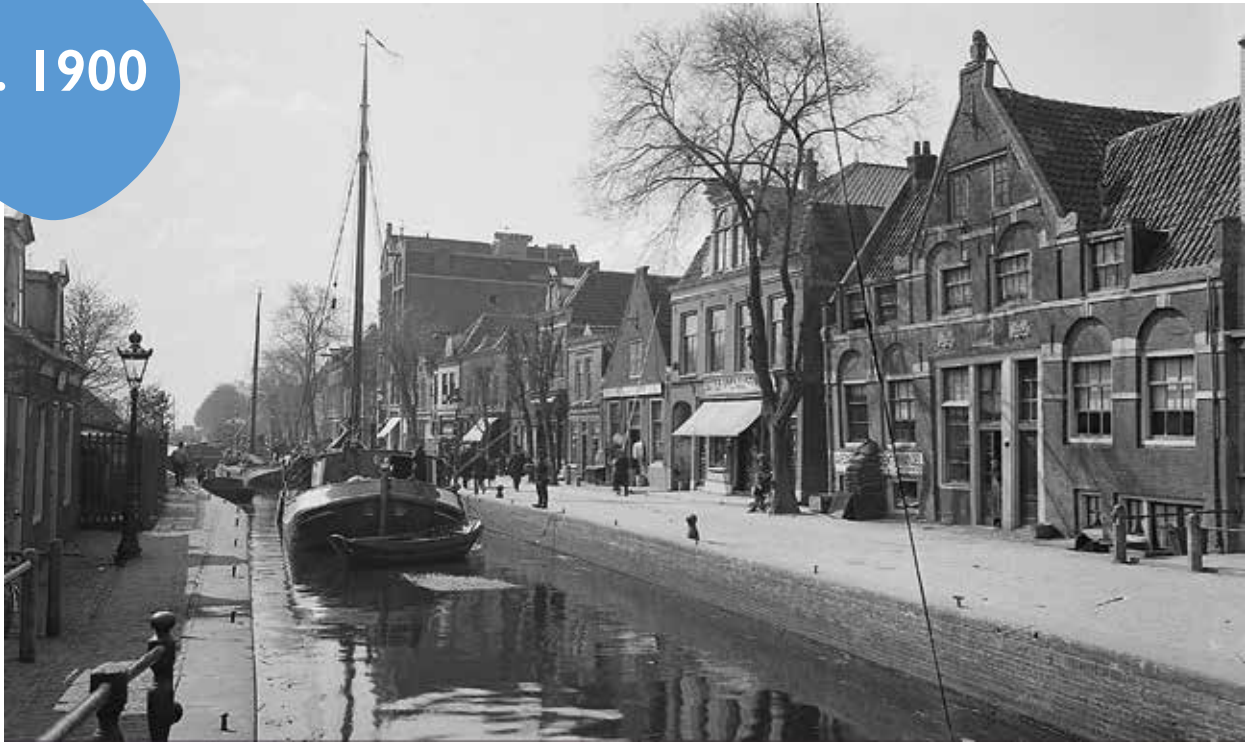
Rechts de Sloterkade met het Aalsmeerder Veerhuis of herberg De Bonte Os. Links het sluispad met de huisjes van de zogenaamde 'Dubbele buurt'.