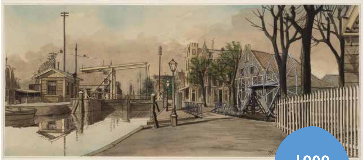
De sluis gezien vanaf de Kostverlorenvaart naar het zuiden. Tijdens de regeerperiode van Louis Bonaparte, beter bekend als Lodewijk Napoleon, broer van de keizer, is in 1809 de overtoom vervangen door een schutsluis. Links de Amstelveenseweg, rechts de windas met de grote wielen om bootjes over de kleine overtoom van- en naar de Slotervaart te trekken. De rolbrug in de kade werd dan geopend. Tekening Herman Misset.