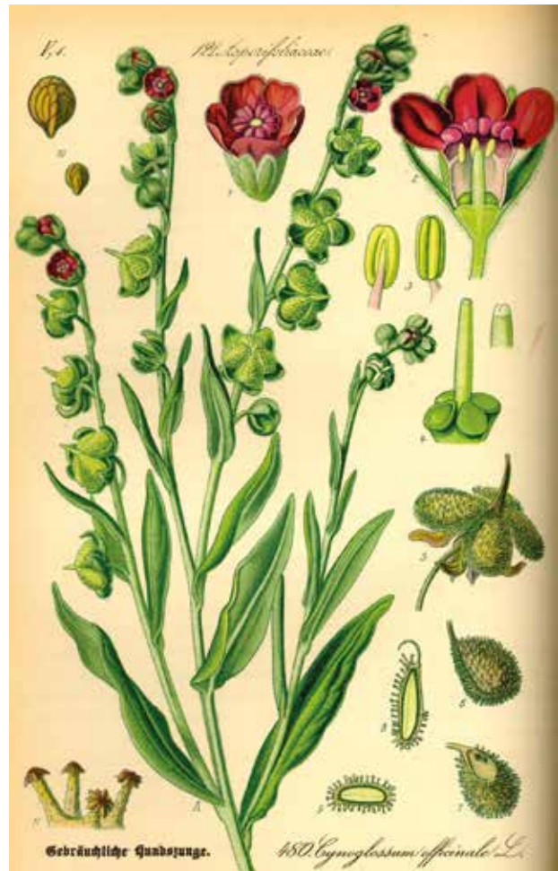
Uit: Prof. Dr. Otto Wilhelm Thomé Flora von Deutschland, Österreich und der Schweiz 1885.

Veldhondstong is binnen de Oeverlanden veel ruimer verspreid dan slangenkruid want heeft een grotere schaduwtolerantie. Ze groeit het best in de zon, maar ook in de lichte schaduw van bosjes. Het is ook één van de plantensoorten die laten zien dat de Oeverlanden een uitgesproken kalkrijk karakter hebben. Veldhondstong groeit vooral op oppervlakkig geroerde grond. De zaden ontkiemen het best als ze licht zijn onder gestoven. Ze zijn dan afhankelijk van voldoende vocht in het voorjaar, hoewel ze later goed tegen droogte kunnen. Ze hebben de neiging om in groepen te groeien,