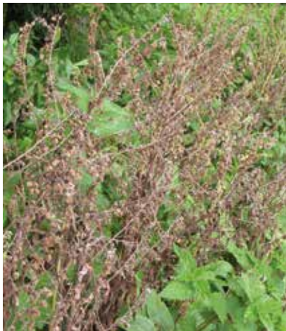
De klitvruchten blijven nog lang aan de afgestorven stengels zitten, soms tot wel één jaar.

( Anchusa officinalis ), ook middelgrote planten die het goed doen in de duinen. Ze hebben een iets andere ecologie, maar groeien in de duinen op sommige plekken ook wel door elkaar heen. In de Oeverlanden doet slangenkruid het vooral goed op de zandige stukken in het centrale deel langs het Anton Schleperspad, maar doet het na droge jaren, waarin er veel gaten in de vegetatie vallen, opvallend veel beter. Gewone ossentong is weleens gezien met een enkel exemplaar, maar komt in de Oeverlanden verder niet voor. Wel handhaven zich in de tuin rond de Waterkant enige exemplaren, waar ze trouwens meerdere keren bloeien en dus meestal niet tweejarig zijn.