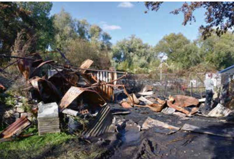
De ochtend na de brand is de ravage pas goed zichtbaar.