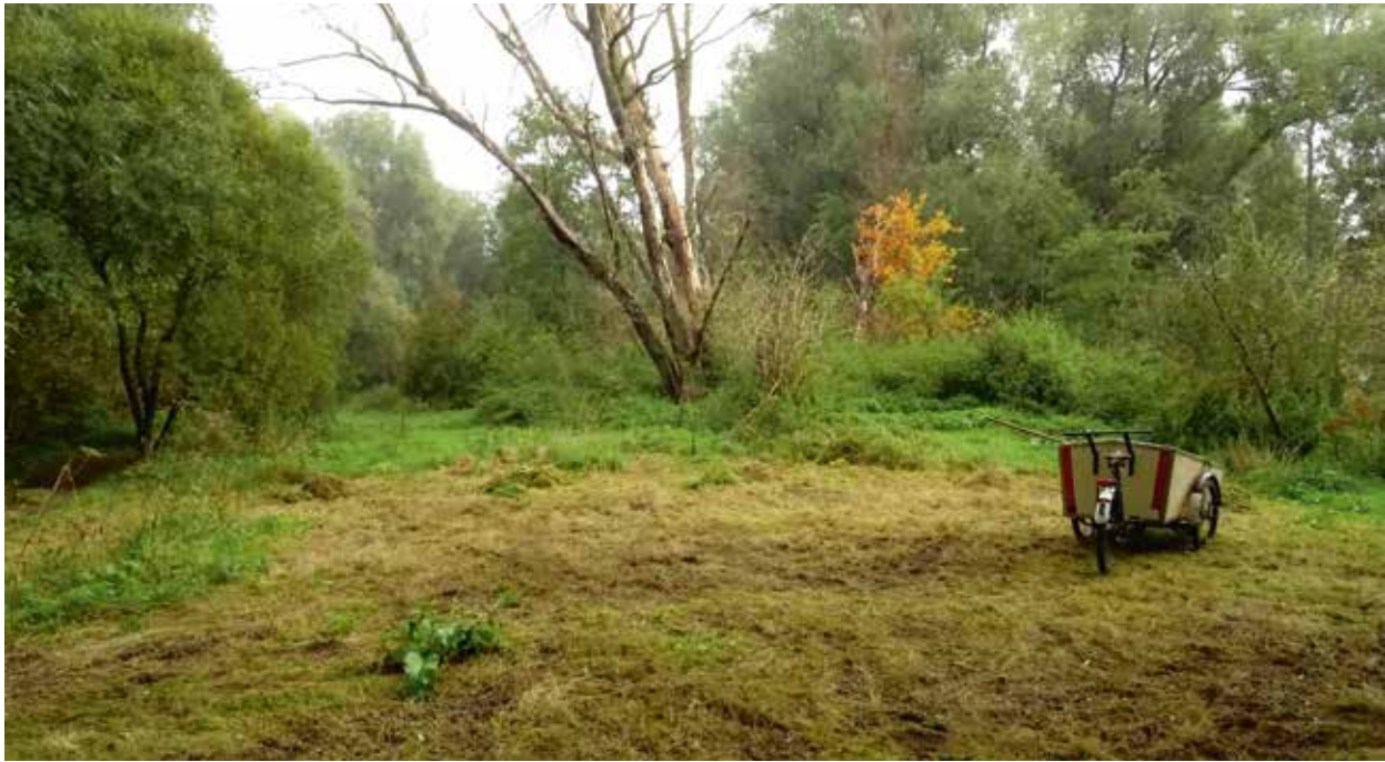
In de herfst blijven na het afharken nog vele dorre, liggende grasstengels achter. Soms is het de moeite waard dit nog met de touwtjes van de draadkop van de bosmaaier af te slaan.

meestal langs oevers groeit. En daarmee is tevens een opvallende eigenschap genoemd van dit stukje grasland: zonder dat de grond ook maar een moment soppig aanvoelt, ook niet tijdens zeer natte perioden als in 2024, voelen planten van natte biotopen zich hier blijkbaar thuis. Dat is ook te zien aan planten als kattenstaart en moerasspirea die het hier en in de onmiddellijke omgeving altijd al goed hebben gedaan. Het blijkt dat ze zich ook goed handhaven tijdens de zeer droge perioden van de laatste jaren. In dit beeld past ook de komst van gevleugeld hertshooi, nog zo'n soort van natte graslanden.