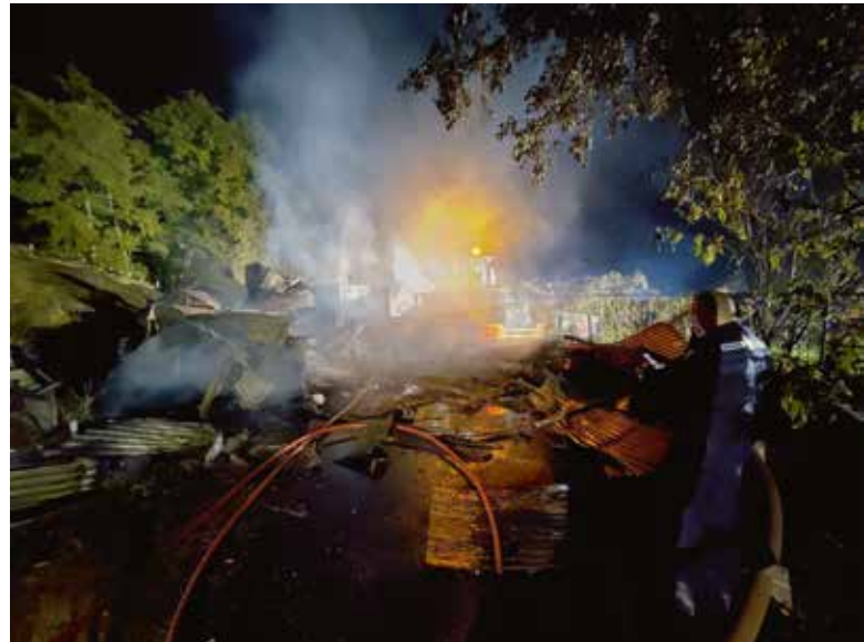
De brandweer probeert de brand te blussen. De loods is helaas niet meer te redden.