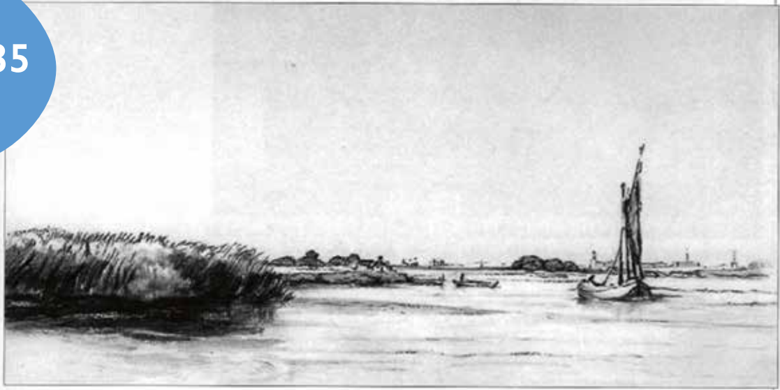
Rembrandt ca 1635 . Zicht op de Schinkel naar het noord-oosten met Amsterdam in het verschiep met het Pesthuys(het latere Wilhelmina gasthuis) en de Westertoren in aanbouw, (vlnr) Vergelijk ook tekening Maria de Clerq 180 jaar later.