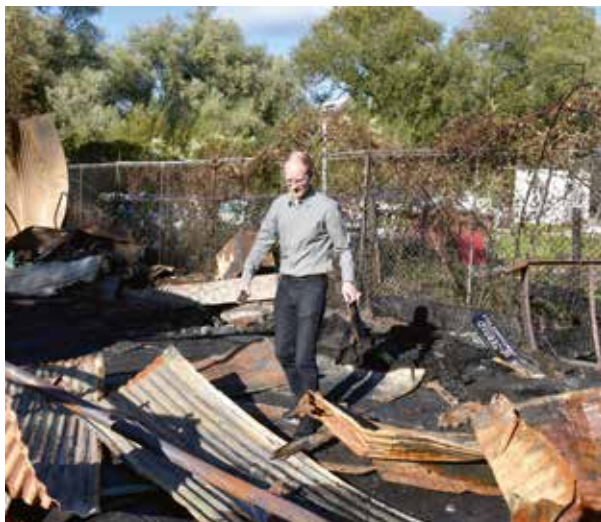
Wichert loopt door de brokstukken van wat een paar dagen geleden nog een loods was.