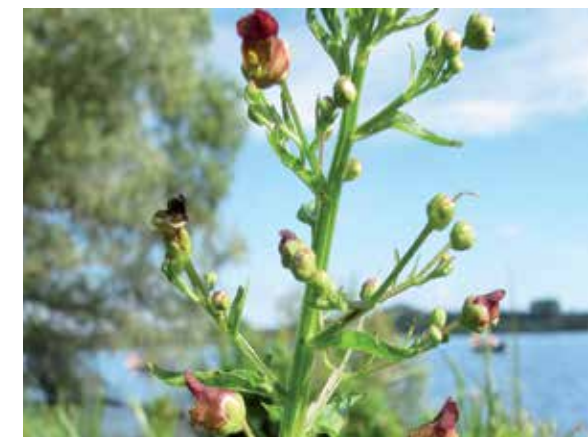
Gevleugeld helmkruid met lijsten (vleugels) langs de hoofdstengels

Als men zaad oogst, kan men het beste er meteen wat mee doen, want het blijft niet lang goed. Vorig jaar werd het toenemende aantal exemplaren op het depot beloond met de zeldzame verschijning van de fraaie rupsen van de helmkruidvlinder, eveneens in de vorige Oever vermeld. Verder verschijnt al gauw de helmkruidbladwesp, die vrijwel zijn volledige cyclus op de plant doorbrengt, want de larven leven van het blad. Komend jaar moet ik maar eens rustig langs het meer lopen om het gevleugeld helmkruid beter te observeren; deze schijnt volgens sommige publicaties nog aantrekkelijker voor bestuivers te zijn.