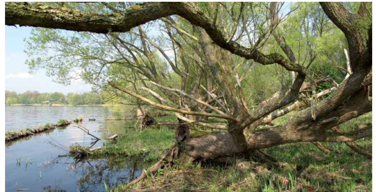
Boezemlandje langs de Nieuwe Meer