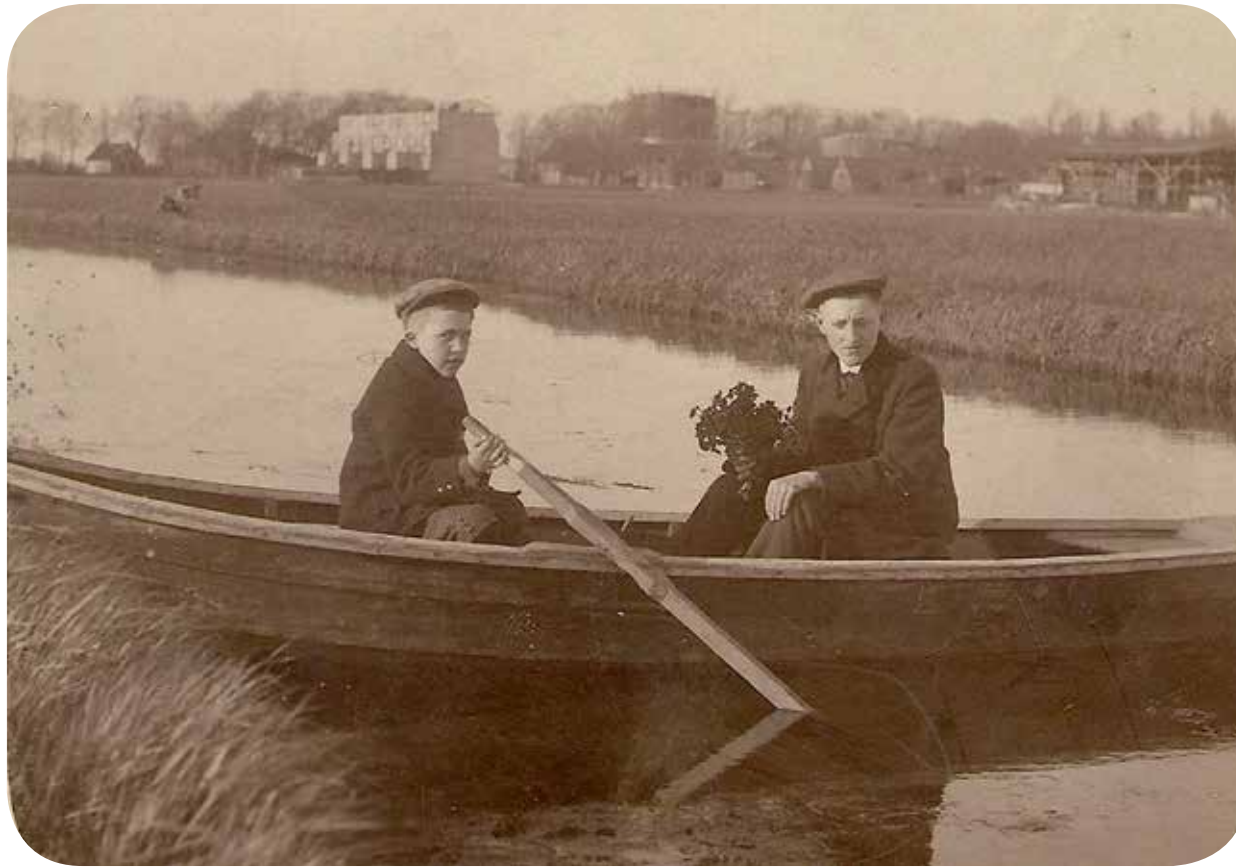
Roeiers op de poldertocht met een bosje dotters in de hand, nabij de Generaal Vetterstraat, april 1916. Er staan pas enkele huizen, rechts de houtloods van de scheepswerf van Speidel, waarnaar later het Spijtellaantje is vernoemd. Links aan de Sloterweg is de gashouder van de gasfabriek van Sloten te zien.