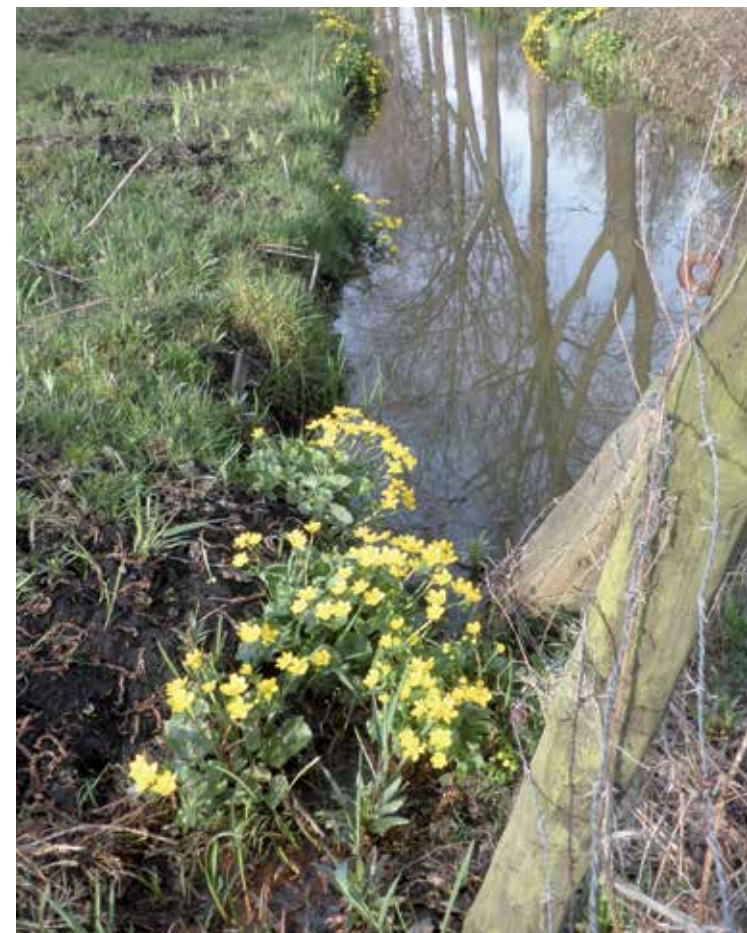
Dotters aan de sloten in de Riekerpolder

Wat heb ik, milde! naar uw komst gesmacht! wat scheen uw toeven lang! -- is 't niet mijn leven dat door uw donzen adem wordt gewekt?