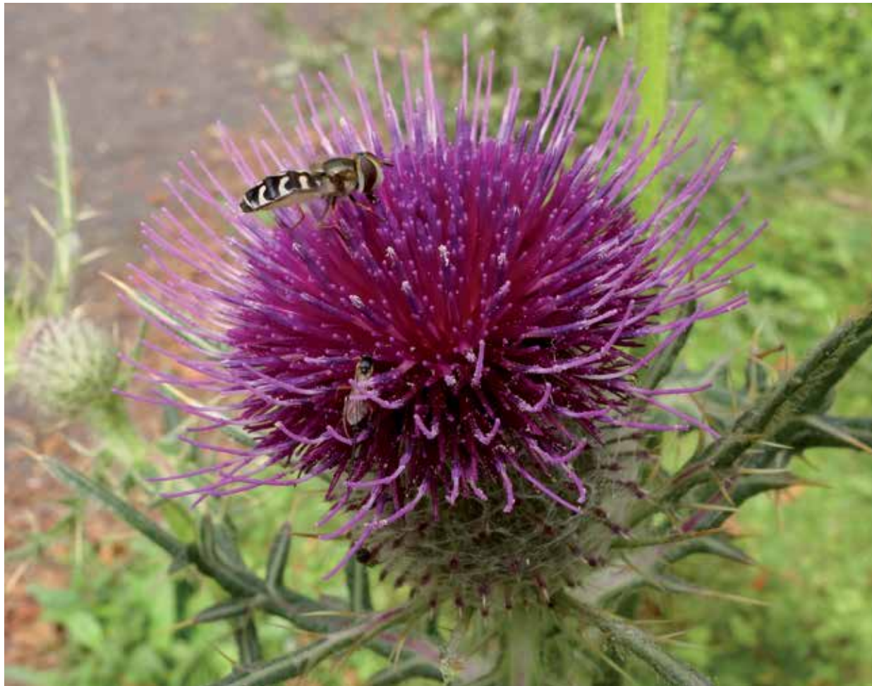
Witte halvemaaazweefvlieg op wollige distel in de depottuin