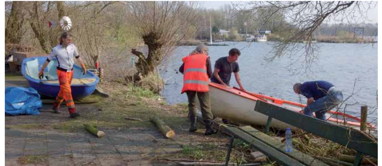
Te water laten van boot ten behoeve van voorzetoever

Een beetje tegelijk met de vlinders verschijnen de eerste nare kopjes van de japanse duizendknoop boven de grond en wat later valt te lezen: 'de mientjes