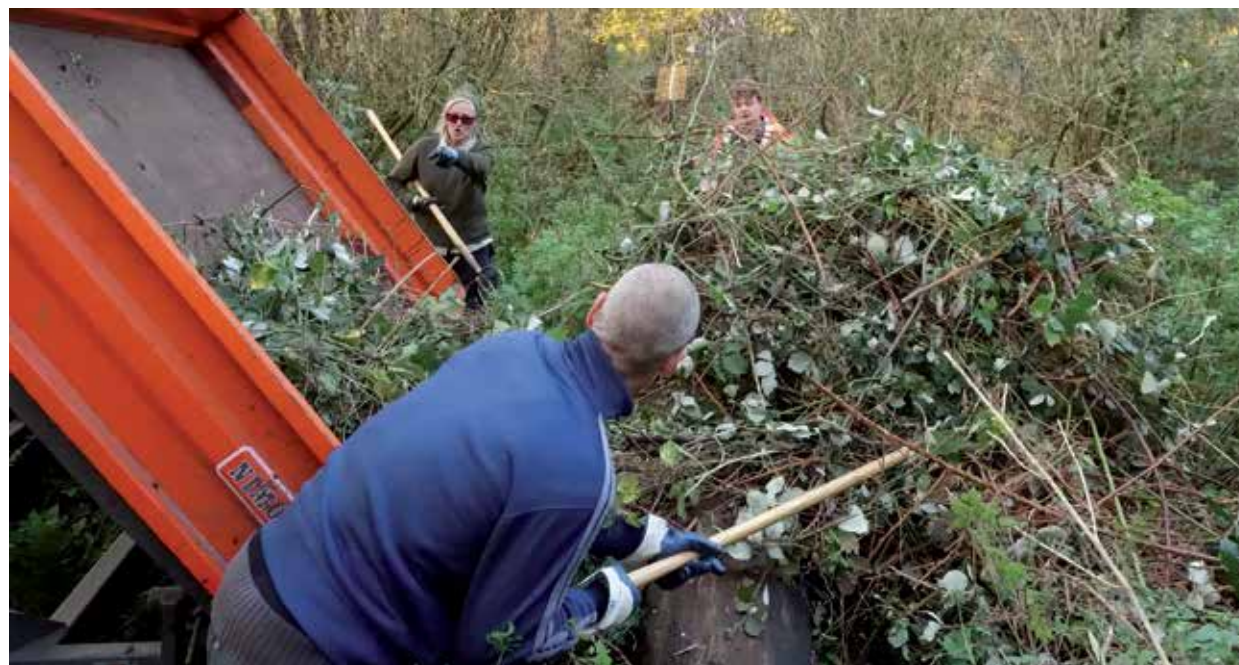
Storten van teruggezet braamstruweel op maaiselloop | Foto: Hans Bootsma