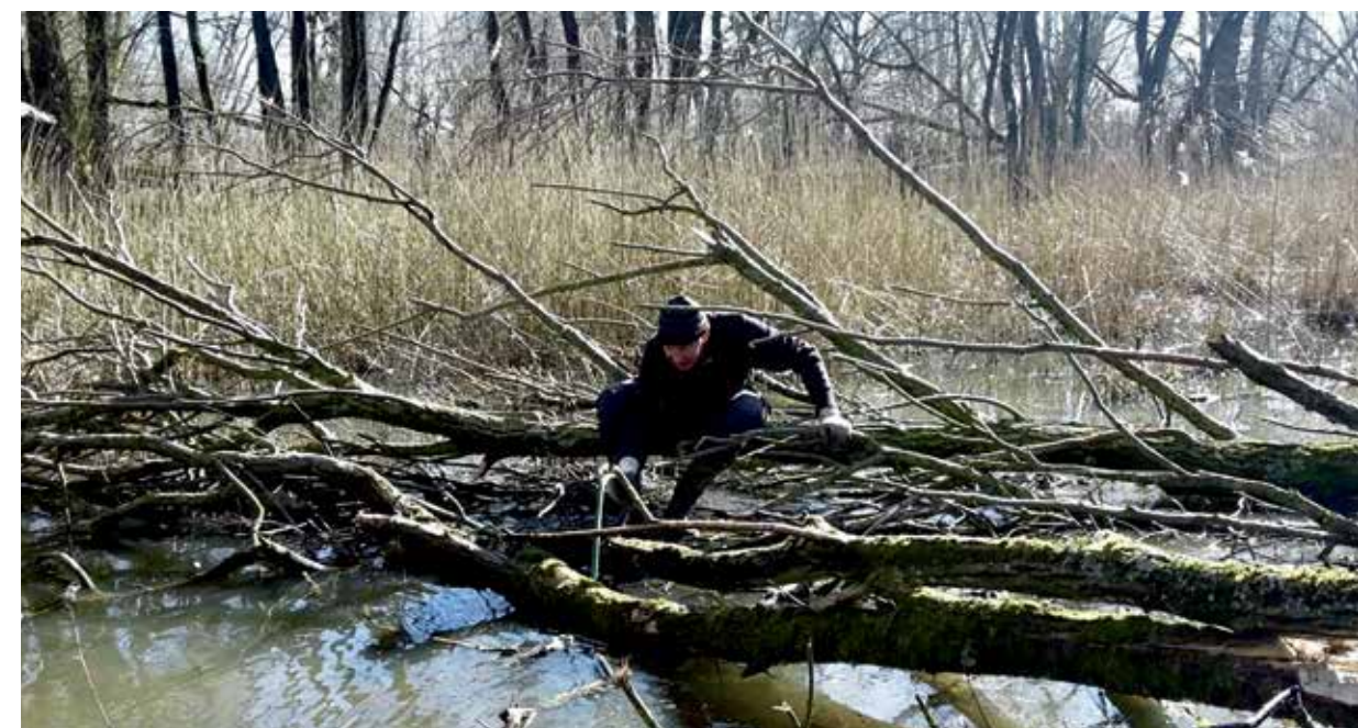
Beheervrijwilliger in het moerasbos