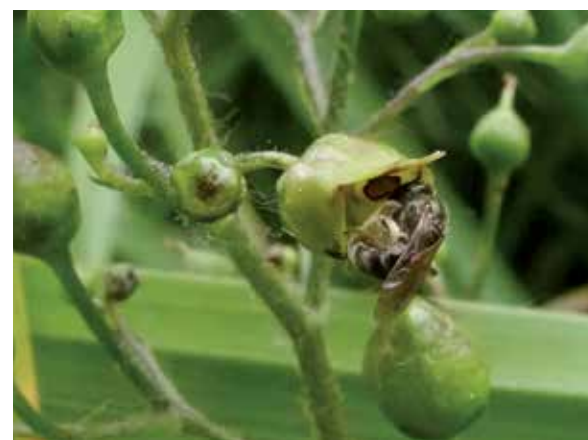
Een groefbij op knopig helmkruid op het depotterrein achter De Waterkant

In tuinen is altijd goed waar te nemen dat knopig helmkruid gemakkelijk hommels aantrekt. Ook honingbijen komen er volop nectar puren. De nectariën lijken voor een grote, constante aanvoer te zorgen, waarbij het grootste deel van het bezoek 's ochtends langskomt. Het bezoek van solitaire wilde bijen is minder, met uitzondering van het uitgebreide geslacht van geurgroefbijen ( Lasioglossum en Halictus ).