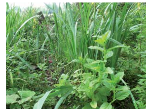
Gevleugeld helmkruid, met een opvallend lichtgroene kleur