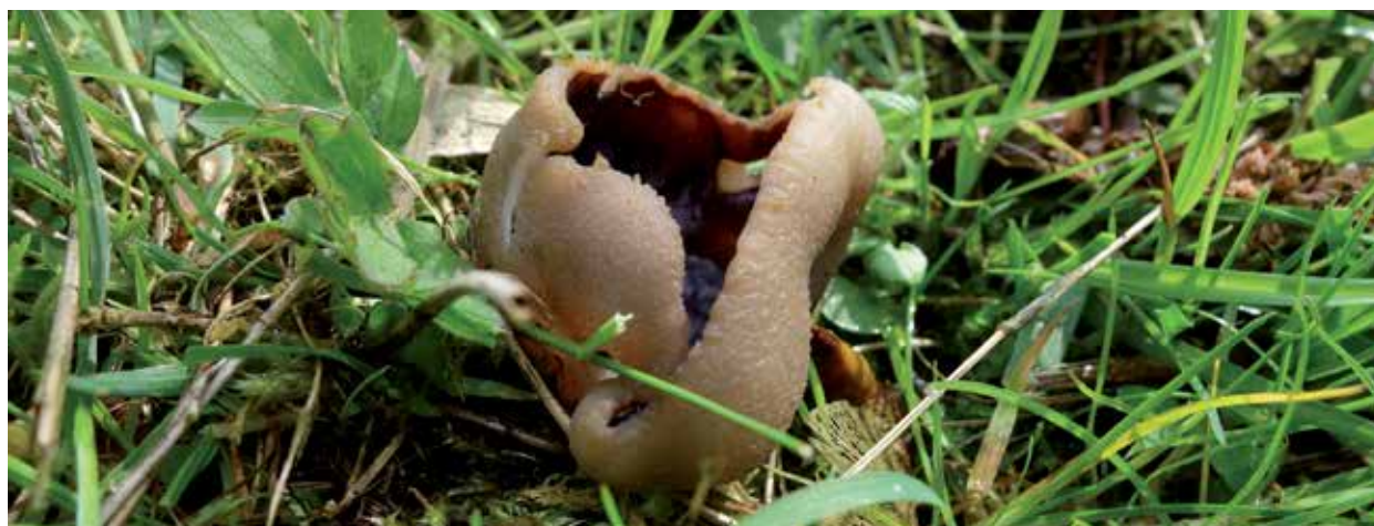
Wijnrode bosbekerzwam