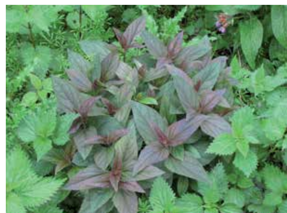
Knopig helmkruid in het voorjaar, met opvallend paarsrood gekleurde bladeren

Knopig helmkruid ( Scrophularia nodosa ) behoort tot één van de twee oorspronkelijk inheemse geslachten in de sinds een jaar of vijftien flink uitgeklede helmkruidfamilie. (Het andere geslacht is toorts of Verbascum .) Hoe gewoontjes ook, ze trekt dusdanig