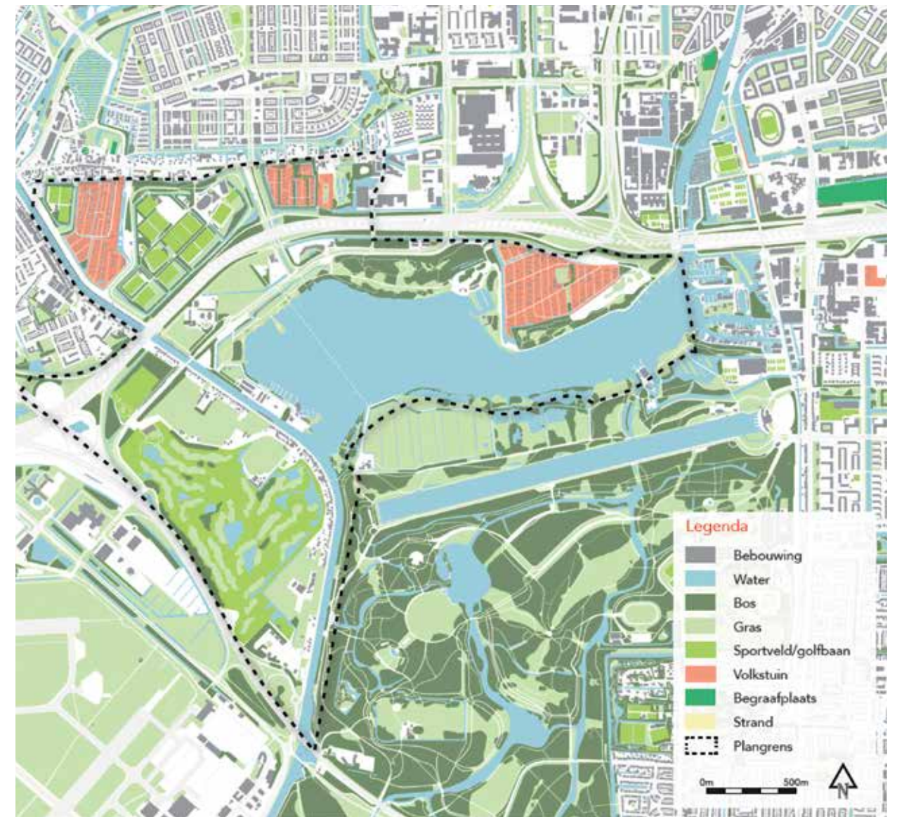
Kaart van een studie naar gebiedsuitbreiding van het Amsterdamse Bos

Een probleem is dat naast de positieve plannen er toch ook weer veel verstedelijking dreigt. Een station Riekerpolder, een idee uit de jaren 80, zou wel eens heel veel city-vorming kunnen opleveren, zoals op de Zuidas gebeurt. Een brug over het Nieuwe Meer doet veel afbreuk aan de wijsheid en de beleving. De winterse zonsondergang zal nooit meer dezelfde zijn, uitkijkend op een hoge brug. Het rondje Nieuwe Meer moet ons inziens wat wijder getrokken worden. Als de veerponten niet varen, kan men de Ringvaart via de brug in de Oude Haagseweg oversteken. Men gaat langs het Koekoekslaantje en de Ringvaartdijk, om twee kilometer verder via de draaibrug bij Schiphol-Oost weer de