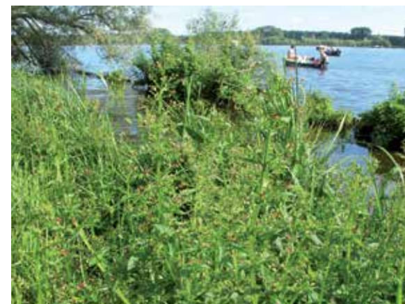
Gevleugeld helmkruid in de boezemlandjes langs de Nieuwe Meer

De soort staat echter vooral bekend als een wespenplant. Hierbij moet men niet denken aan de wespen die vervaarlijk kunnen steken, de zogenaamde sociale wespen of papierwespen, maar aan de vele soorten solitaire wespen. Deze vangen voor hun broed weliswaar larven van allerlei insecten, maar ze hebben voor hun eigen energievoorziening nectar nodig. De plant schijnt zeer aantrekkelijk te zijn voor onder andere de deukmetselwespen, die gebruik maakten van het insectenhotel (zie Oever 74).