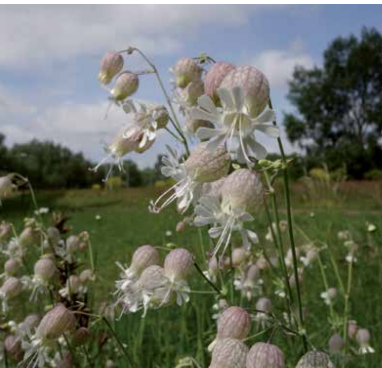
Blaassilene langs de Oude Haagseweg