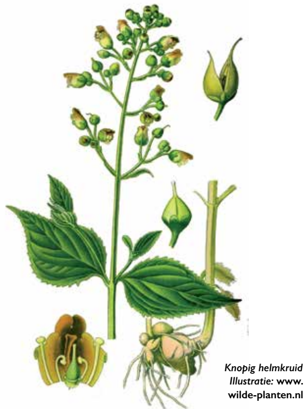
Knopig helmkruid Illustratie: www.wilde-planten.nl