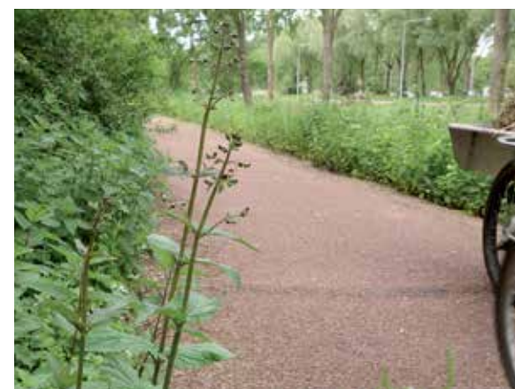
Knopig helmkruid in de berm langs de Ecosloot achter de recreatiezone

Op het depot bevorder ik het knopig helmkruid door deze zo goed mogelijk uit te laten zaaien en een enkele keer met de afgeknipte stengels rond te zwaaien.