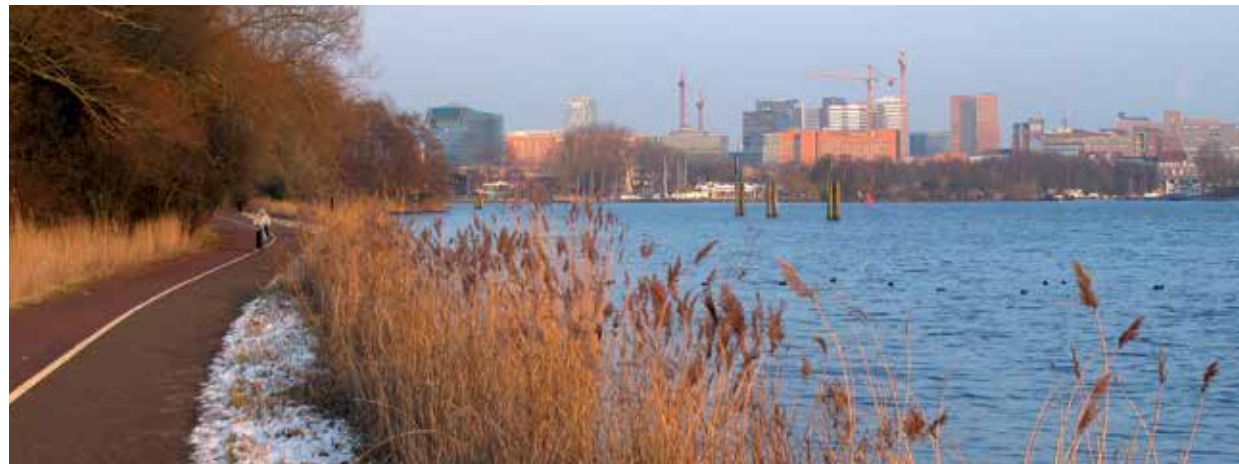
Jaagpad met de dreigende Zuidas op de achtergrond

Foto voorpagina: bitterkruidbremraap op de Vlinderburcht in de depottuin