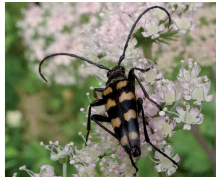
Gevlekte smalboktor