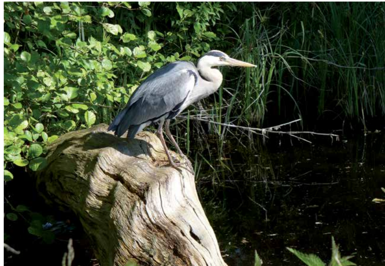
Blauwe reiger

de blauwe reiger hapt met een scherpe snavel zijn spiegelbeeld stuk