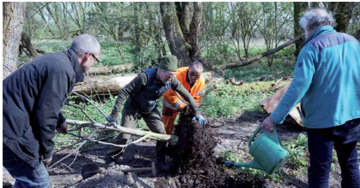
Walnotenboompje verplanten in het Jaagpadbos