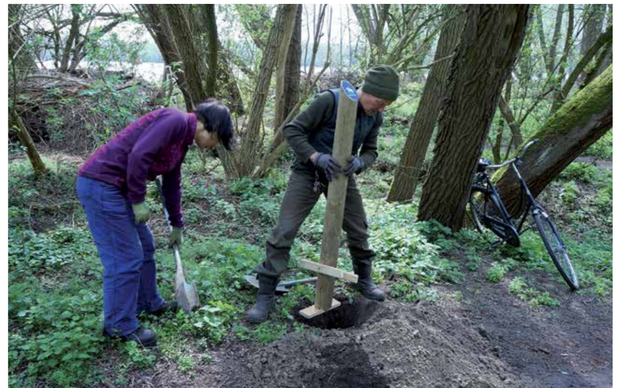
Ruiterpaaltjes plaatsen in het Jaagpadbos