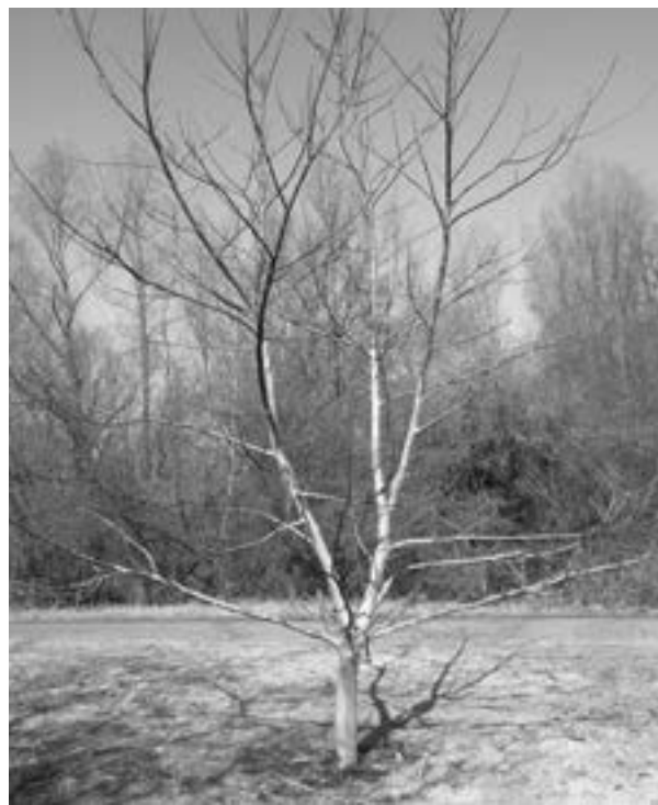
Walnotenboom geplant voor de komende honderd jaar; dat het vrucht mag afwerpen