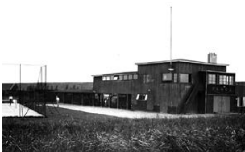
FAMOS (Federatie voor Amsterdamsche Middelbare scholen voor Ontspanning en Sport), 1932