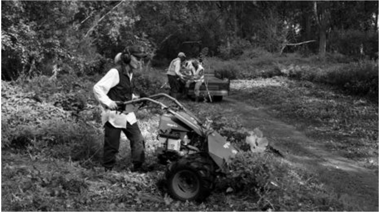
Aan de slag