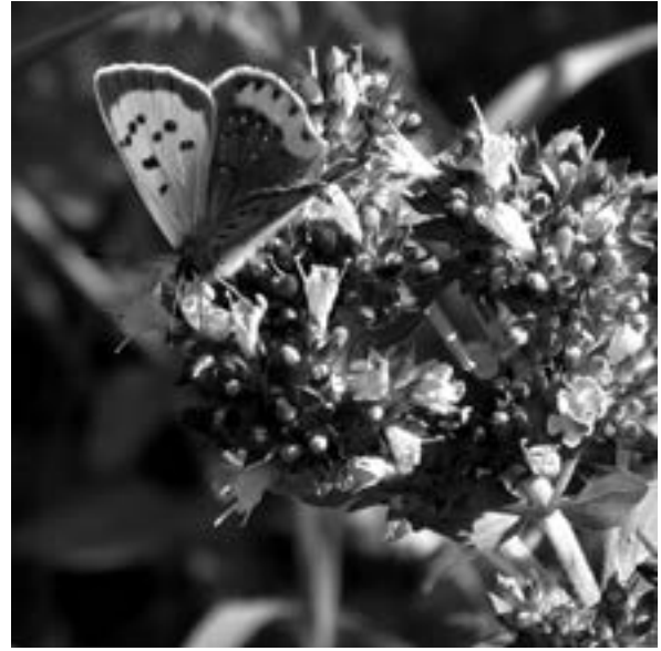
Kleine vuurvliinder

belen. De plant is goed als kruid te gebruiken. Fijnproevers zullen het misschien te sterk vinden en de voorkeur geven aan de fijnere eenjarige, niet-inheemse soort, maar veel verschil is er niet. Het past goed bij pizza's, tomatensaus en sommige salades.