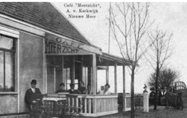
Café Meerzicht, Jaagpad nr 241, 1915