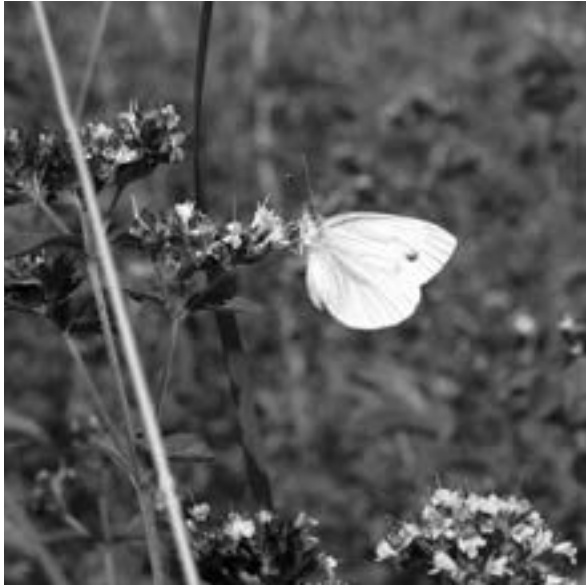
Klein geaderd witje