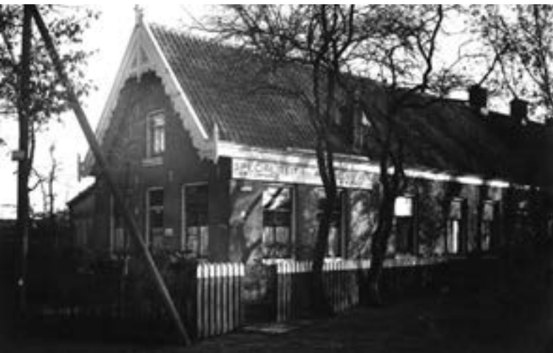
Begin van het Jaagpad aan de Sloteweg, café Huis te Vraag op nr 1, 1925