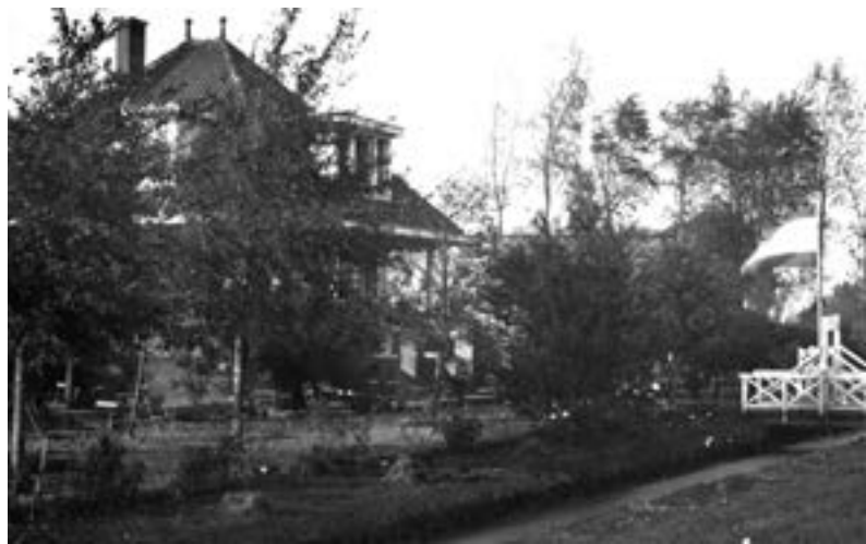
Uitspanning Bella Vista, Jaagpad nr 123, 1922