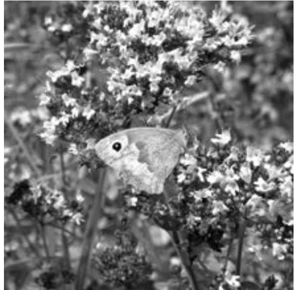
Bruin zandoogje