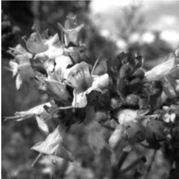
Wilde marjolein