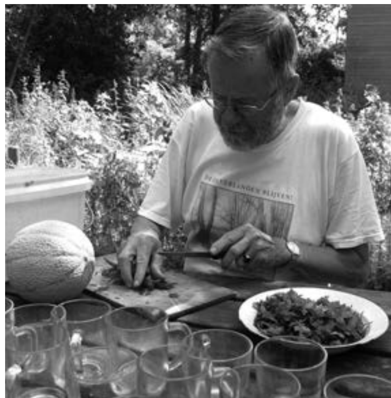
Brandnetelthee | Foto: Hans Bootsma