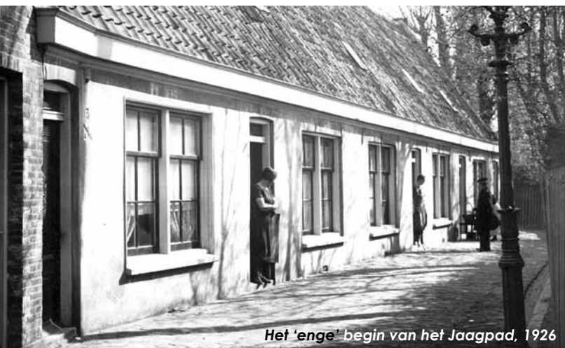
Het 'enge' begin van het Jaagpad, 1926