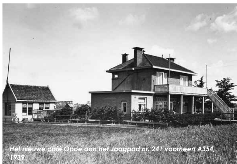
Het nieuwe café Opoe aan het Jaagpad nr. 241 voorheen A354, 1939