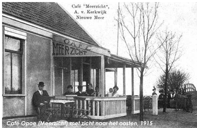
Café Opoe (Meerzicht) met zicht naar het oosten, 1915