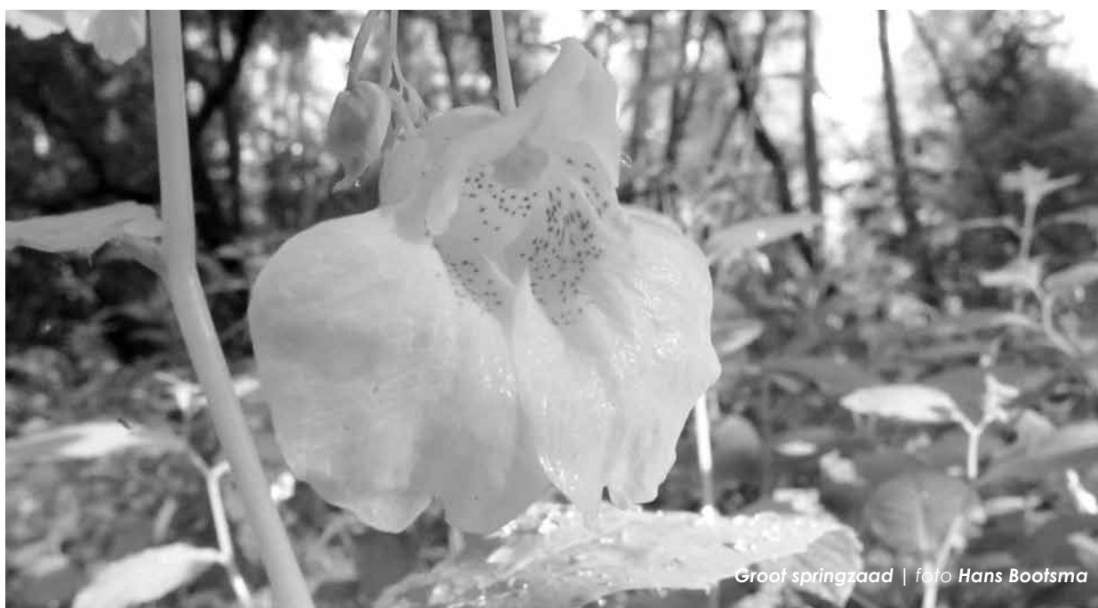
Groot springzaad