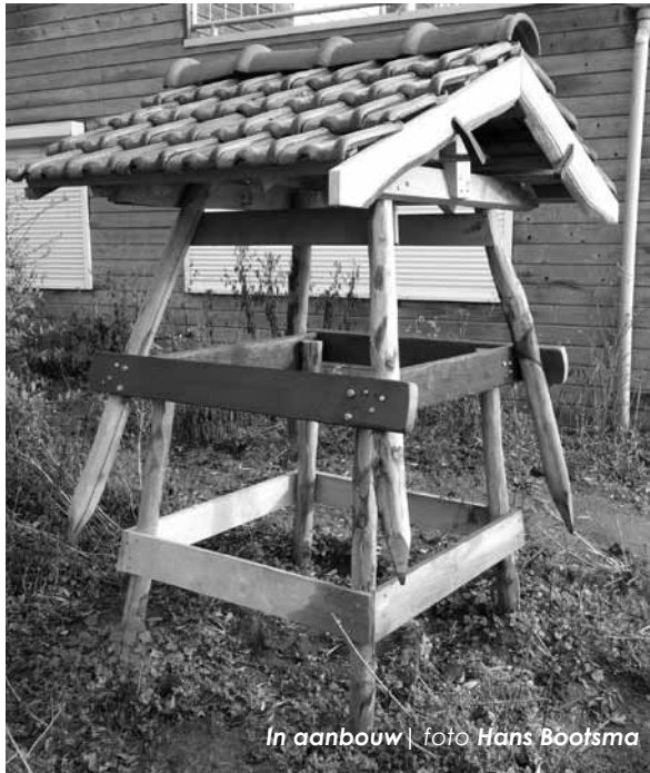
In aanbouw

overal in de Oeverlanden is een rijkdom en variatie aan nectarplanten als op het depot aanwezig. Al zullen de vele verschillende soorten wilgen overal in het voorjaar een goede bijdrage leveren. Maar wilde bijen hebben een veel kleinere actieradius dan de honingbij.