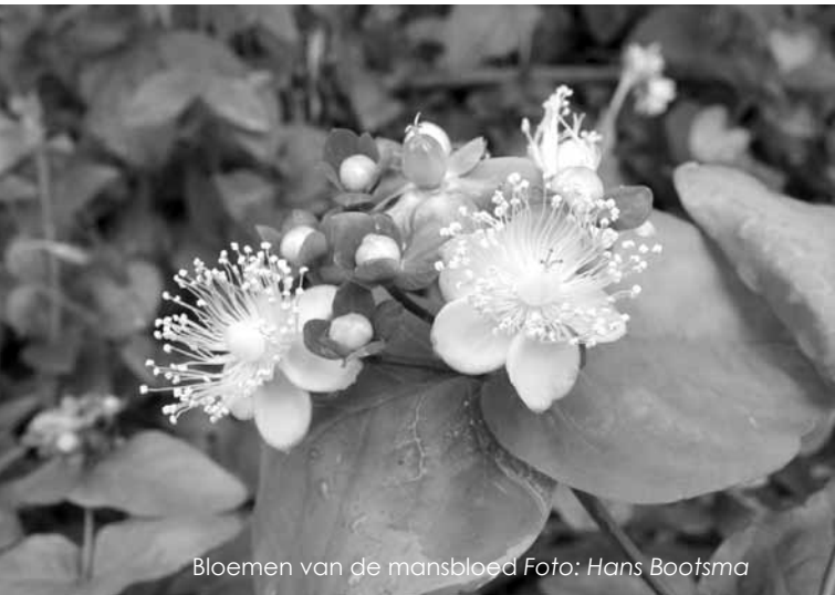
Bloemen van de mansbloed

opgekomen uit kort na de aanleg rondgestrooid zaad op relatief droge plekken.