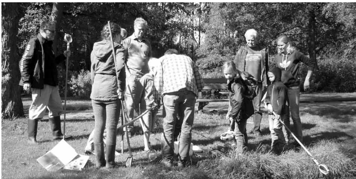
Waterdierpjes scheppen

Druk: De Appelbloesem Pers, Amsterdam, oplage: 1100