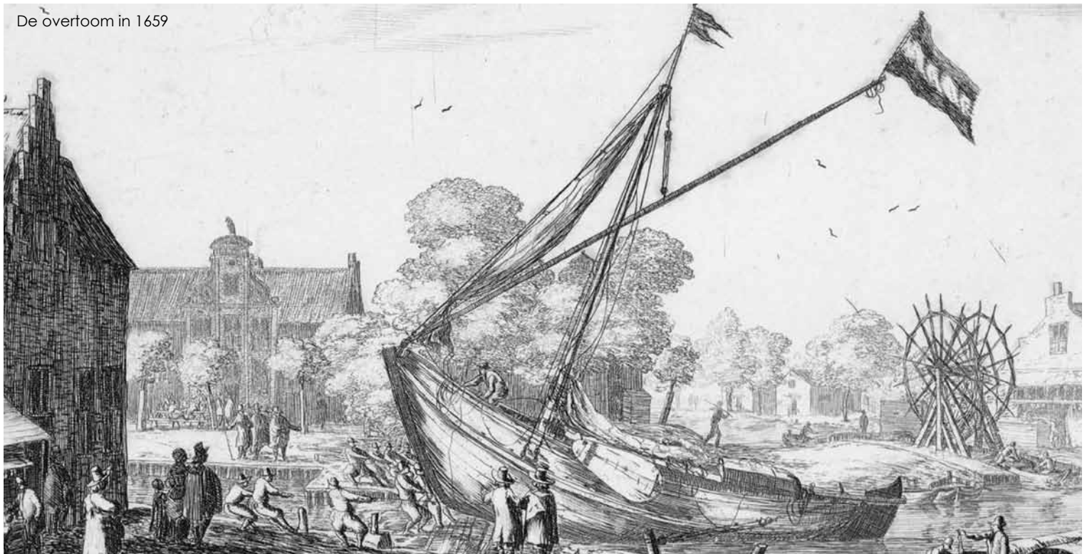
De overtoom in 1659