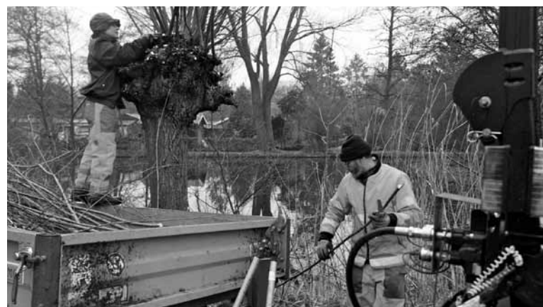
Beheervrijwilligers knotten wilgen