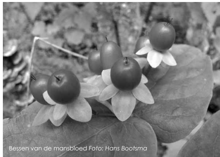
Bessen van de mansbloed