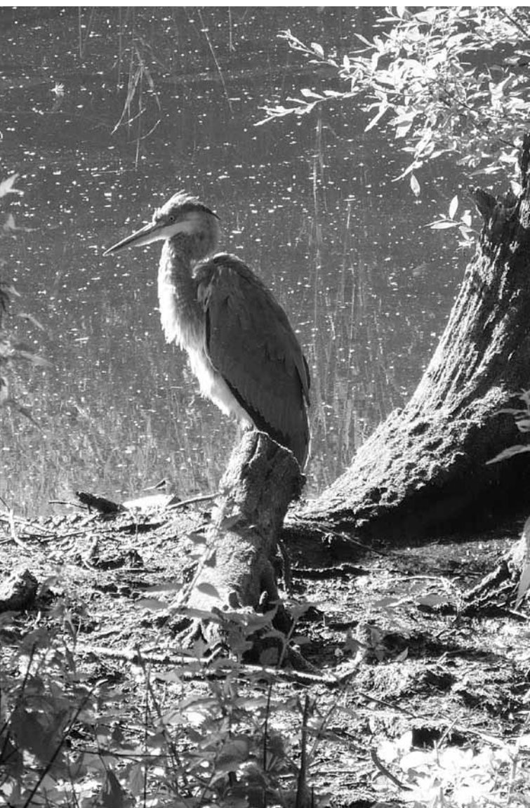
Blauwe reiger bij de Anton Schlepersplas