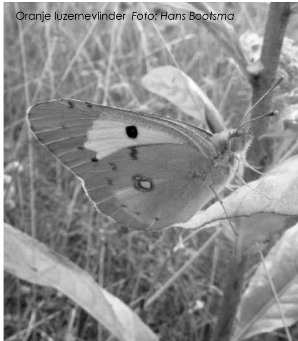
Oranje luzernevlinder