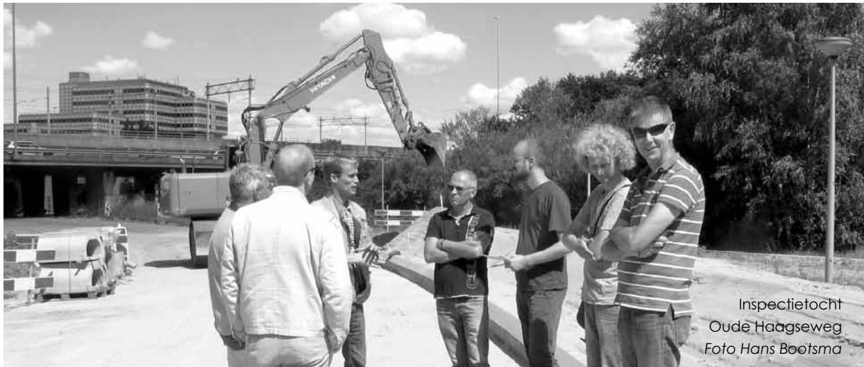
Inspectietocht Oude Haagseweg