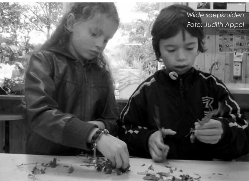
Wilde soepkruiden

De gemeente Amsterdam wil de voedselhoofdstad van Europa worden. De stad waar innovatie, opleiding en kennis rond voedsel samen komen. De gemeente wil daarmee de economische belangen van de stad dienen en inspelen op de vraag van Amsterdammers naar lokaal en verantwoord voedsel, en om zelf aan de slag te gaan.