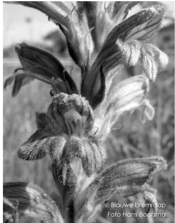
Blauwe bremraap

Het stukje middenberm ten oosten van het Christoffel Plantijnpad is als grasland beter ontwikkeld dan enige grazige vegetatie in de Oeverlanden zelf. Hier zijn nog eens ten minste tien rodelijstsoorten die niet in de Oeverlanden zelf voorkomen. Vlinders als icarusblauwtjes, sintjansvlinders en zwartsprietdikkopjes komen hier in flinke aantallen voor; de berm fungeert als kraamkamer. In verschillende (uit)hoekjes zijn planten als aardaker, ruige anjer, rietorchis, kleine ratelaar, grote pimperl, hokjespeul, knooppkruid en glad walstro te vinden. Bij goed beheer kunnen steeds meer spraakmakende plantensoorten zich langs de hele weg verbreiden, tot in de Oeverlanden zelf.