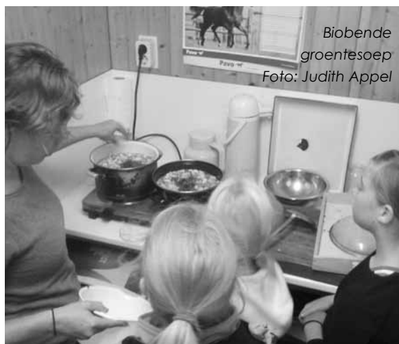
Biobende groentesoep

Bovenstaande tekst is grotendeels overgenomen van de websites van het Anmec en Food Cabinet.