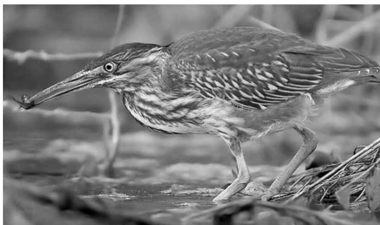
Eind april 2006: de groene reiger in de Jaagpadsloot.

Zeldzame (dwaal)gasten roepen altijd veel vragen op. Zo'n vraag is bijvoorbeeld: welke soort is het? Uit