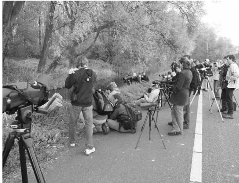
Toevloed van vogelaars en pers.