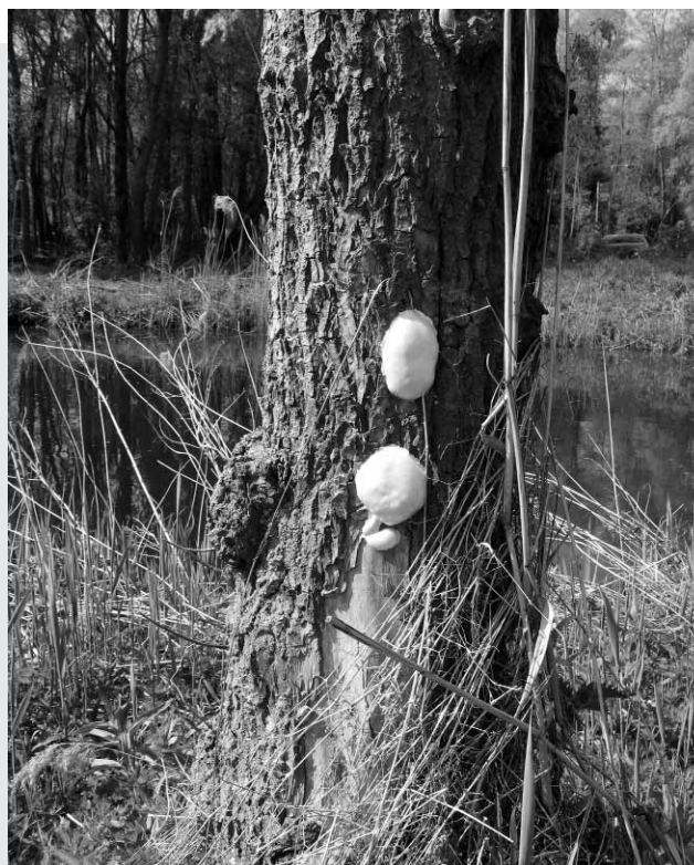
Afgelopen april verschenen deze slijmzwammen op een knotwilg langs de Riekerweg.

Alleen: het is helemaal geen paddestoel, het is een slijmzwam. Slijmzwammen vormen een heel aparte groep, die niet meer tot het planten- of dierenrijk wordt gerekend, maar samen met wat andere groepen organismen een apart 'rijk' is, waarover onder biologen overigens geen totale overeenstemming bestaat. Ze zijn zeker niet zeldzaam maar vaak klein en verborgen. Maar zo nu en dan valt je oog op een mooi exemplaar - ook in de Oeverlanden.