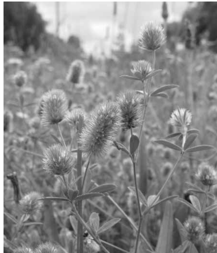
Hazepootje, een eenjarige klaversoort

De nieuwe asfaltlaag van vijftien centimeter komt op de al liggende platen van gewapend beton, die hier en daar scheuren beginnen te vertonen, maar nog sterk genoeg zijn om zonder verdere funderingswerkzaamheden een nieuwe asfaltlaag te dragen. Wel zal hierdoor een niveauverschil optreden tussen het wegoppervlak en de berm, dat door het storten van een dunne laag aflopende grond overbrugd zal moeten worden. We drongen erop aan hiervoor voedselarm, kalkrijk zand te gebruiken, overeenkomstig de